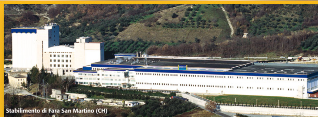
Stabilimento di Fara San Martino (CH)