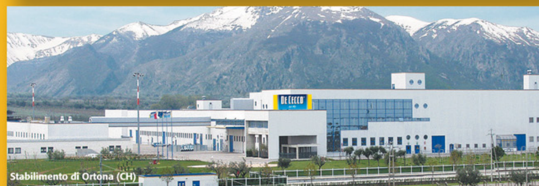
Stabilimento di Ortona (CH)

Rispetto delle persone e delle regole, correttezza ed equità nelle relazioni, lealtà e trasparenza nella comunicazione. Relazione profonda ed autentica con il territorio cui apparteniamo e con la cultura che questo esprime. Continuità di governance familiare Miglioramento della qualità della vita dei consumatori e responsabilità verso le generazioni future.